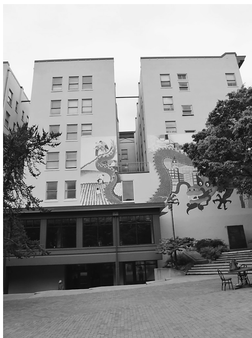
写真 ブッシュホテルおよびSCIDPDA事務所 (同ホテル1階)

「これ (PDA の仕組み創出) によって、お金を扱う権限が、市当局からPDAに移管されることとなった。」「PDAがお金を扱う権限というのは、土地購入やリースをおこなう権利等々を得る、ということだ。」